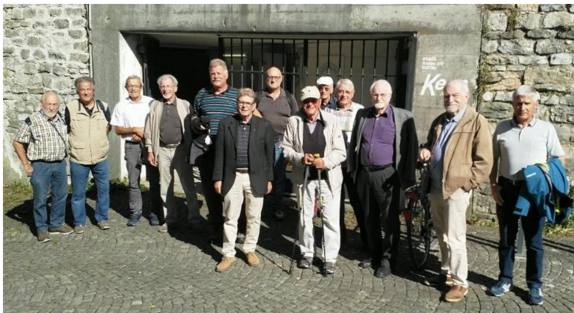
Incontro seniores PGS 2021 ad Aarau